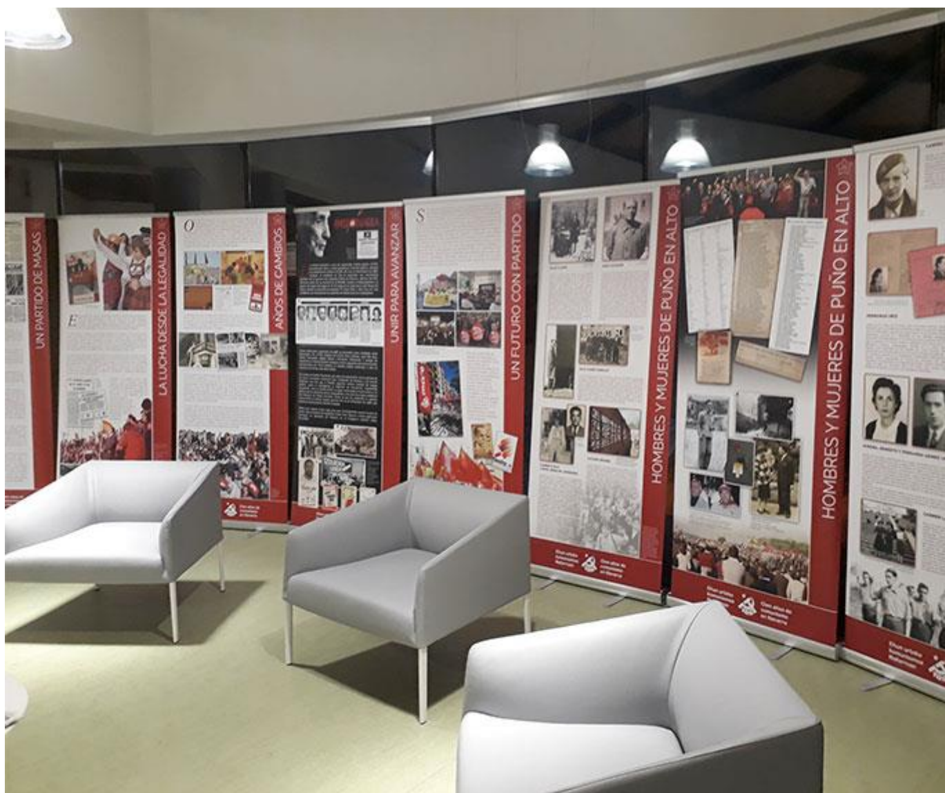
Paneles de la exposición itinerante 'Hombres y mujeres de puño en alto. 100 años de comunismo en Navarra'

De carácter itinerante, está compuesta por paneles que contienen fotos, carteles, documentos, recortes de prensa y una selección de biografías que resumen la historia del Partido Comunista de Navarra en su 100 aniversario.