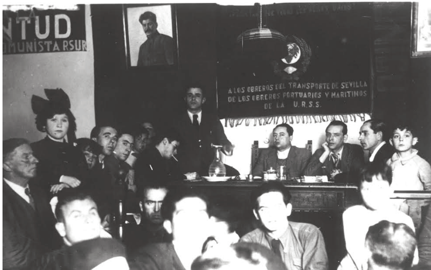
José Díaz en una conferencia en Sevilla. 1932